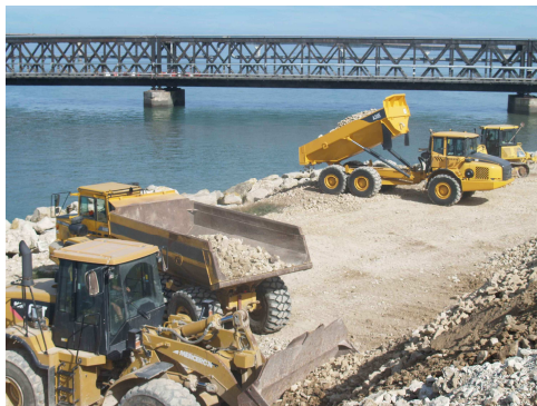
La Repentie : démarrage des travaux le 14 septembre 2010.