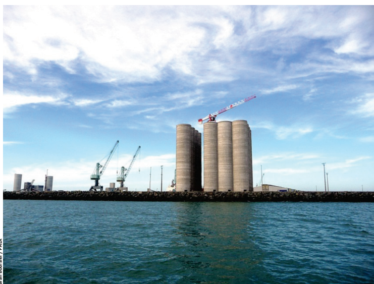
Sarah Boursier / PALR

Avec plus de 25 M€ investis en 2016, les opérateurs rochelais se donnent les moyens de leurs ambitions pour renforcer leurs atouts dans les années à venir.