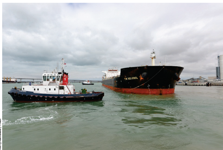
Thierry Bambaud / PALR

Avec + 11 % et 849 836 tonnes traitées en 2016, les produits forestiers et papetiers sont portés par l'évolution du trafic de pâte à papier qui atteint 695 027 tonnes, soit près de 16 % de croissance et 95 000 tonnes supplémentaires par rapport à 2015. Grumes, sciages et placages maintiennent pour leur part un niveau globalement équivalent à celui de l'année précédente.