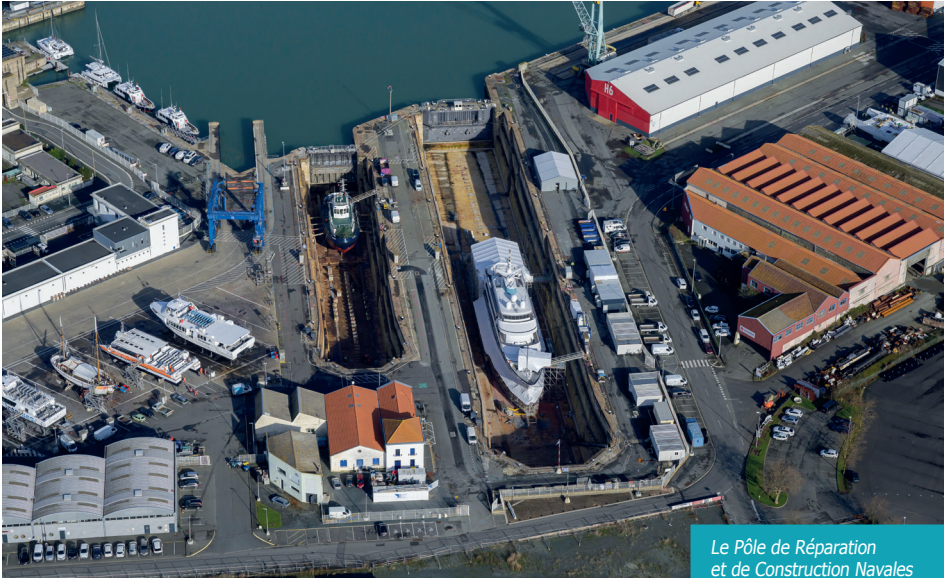
Le Pôle de Réparation et de Construction Navales

Sur le site du Pôle de Réparation et de Construction Navales, la plupart des indicateurs sont à la hausse pour l'année écoulée. Revue de détail.