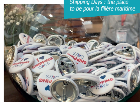
Shipping Days : the place to be pour la filière maritime

la première édition qui avait été un succès. Le nombre d'exposants est en forte hausse avec notamment, parmi les nouveaux venus, le port d'Anvers-Bruges. La quasi-totalité des principales places portuaires françaises sera présente aux côtés des armateurs, chargeurs, porteurs de projets, notamment pour l'éolien offshore, et porteurs de solutions innovantes. Le programme de ces deux journées propose également des conférences, avec l'intervention d'experts et de professionnels : « Le marché du conventionnel, où en est-on en 2024 ? » ; « Transports rouliers : les enjeux logistiques » ; « EMR, comment se préparer au marché du flottant ? » ; « Breakbulk, l'innovation au service de la décarbonation ».