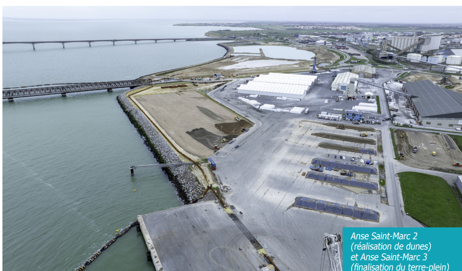
Anse Saint-Marc 2 (réalisation de dunes) et Anse Saint-Marc 3 (finalisation du terre-plein)

L'expérience réussie de la place portuaire comme hub logistique pour les fondations du parc éolien en mer de Saint-Nazaire de 2021 à 2022 a porté ses fruits. A partir du mois de mars, ce sont les éléments destinés au parc éolien d'Yeu-Noirmoutier qui vont transiter par le Port.