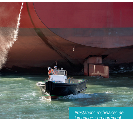
Prestations rochelaises de lamanage : un agrément reconduit pour dix ans