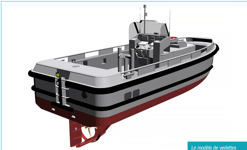
Le modèle de vedettes en construction

« Nos deux futures vedettes viendront en remplacement de trois actuellement en service à La Rochelle, l'une de ces dernières pourrait être à ce moment-là repositionnée sur les ports de Rochefort et Tonny-Charente. Des discussions vont prochainement être engagées à ce sujet pour tenir compte des besoins et particularités de ces ports fluviaux,