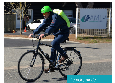
Le vélo, mode alternatif privilégié

« Cette enquête nous enseigne que nous sommes en bonne voie vers la décarbonation des trajets domicile-travail, résume Alexia Fichou, chargée de Suivi environnemental à Port Atlantique La Rochelle. Des leviers d'actions sont identifiés pour poursuivre la