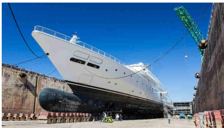
Mégayacht de 138 m à La Ciotat

Forts de ces deux sites exceptionnels, La Ciotat et La Rochelle, en s'associant à Atlantic Refit Center, Compositeworks veut ainsi offrir à ses clients le choix de réaliser des prestations de très haute qualité et de grande rigueur sur chacune des deux façades maritimes de l'Europe de l'Ouest : la Méditerranée et l'Atlantique. Cette union scelle la mise en commun immédiate de moyens matériels, humains et de savoir-faire reconnus pour répondre avec la plus grande exigence aux attentes des armateurs.