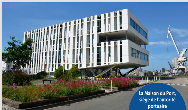
La Maison du Port, siège de l'autorité portuaire

Les fonctions transversales travaillent ensemble à de nouveaux outils plus performants pour le fonctionnement interne et le service aux clients, illustrés en 2025 par le développement de la plateforme Escale +.