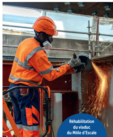
Réhabilitation du viaduc du Môle d'Escalé

Encore un chantier de taille engagé en 2025 : la réhabilitation du viaduc du Môle d'Escalé, ouvrage emblématique du Port. La première phase de ce programme, débutée au printemps, s'achèvera fin 2027 pour un coût d'environ 22 M€. À partir de 2028, s'engagera la seconde phase avec la réparation de la charpente métallique supérieure.