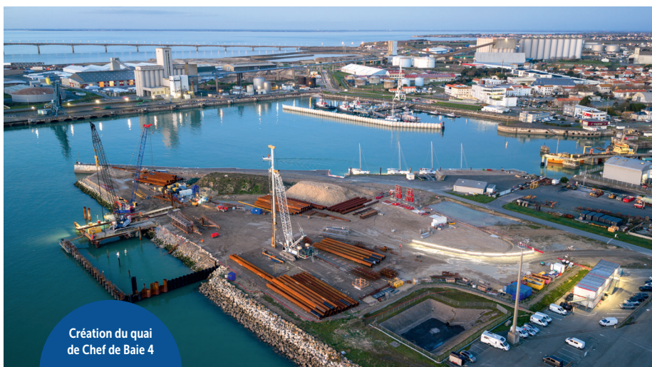
Création du quai de Chef de Baie 4

La plateforme mixte civile et militaire, tout d'abord, a été achevée en janvier après plus d'un an de travaux. Cet aménagement sur le site de La Repentie d'un coût global de 5 M€, inscrit au contrat de Plan État-Région 2023-2027, a fait l'objet d'un cofinancement européen.